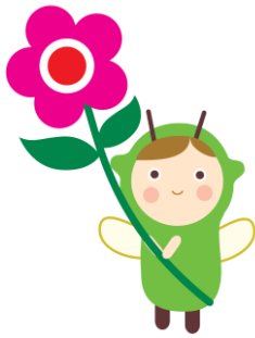
都筑区社協キャラクター ゆいピー

市営地下鉄「センター南」駅より 徒歩7分 公共交通機関でのご来場を お願いいたします!