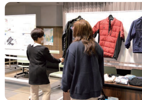
お渡し会当日の様子