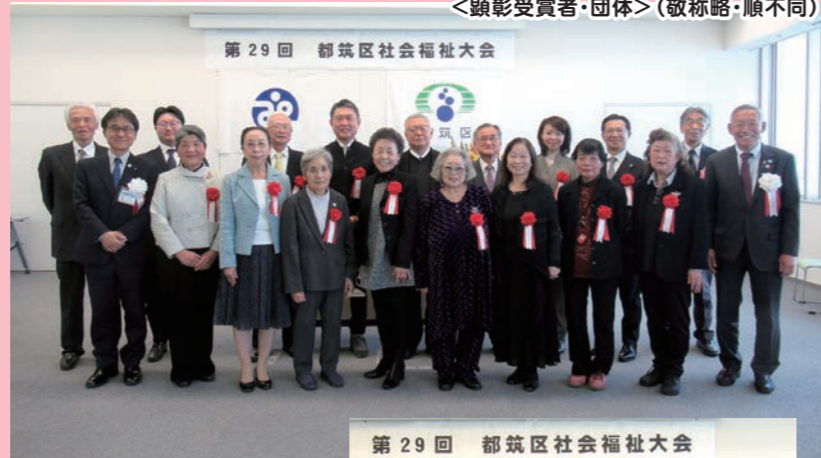
受賞者のみなさま