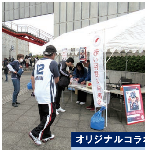
区民Dayでの募金活動の様子

今年度も横浜ビー・コルセアーズ 区民Dayにお伺いさせていただき、募金活動を行いました。当日は、日本ボーイスカウト横浜第132団ボーイ隊様にご協力いただき、募金活動を実施しました。募金額に応じて、横浜ビー・コルセアーズ様と神奈川県共同募金会都筑区支会とのオリジナルコラボグッズをお渡しさせていただきました。試合前2時間で、85,892円のご協力をいただくことができました。