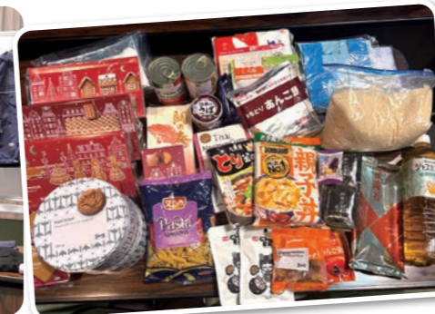
各世帯にお渡しした食料品セット(例)