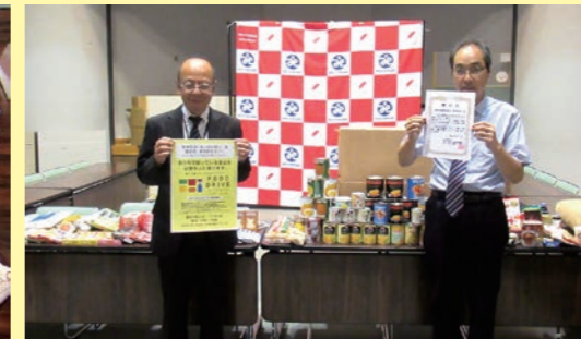
阪急阪神百貨店 都筑阪急様