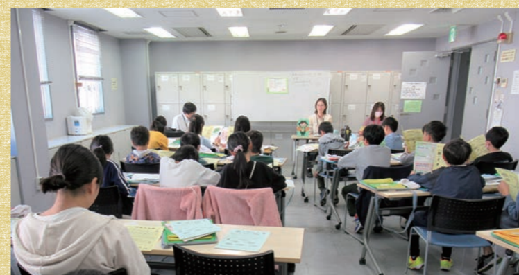
都筑区社協があるかけはし都筑に来てくれた様子

学校での福祉教育の一環として社会福祉協議会に興味を持ってくれたクラスでは、社会福祉協議会がどこかを知ることから、都筑区社協に来てくれました。都筑区社協職員の説明を聞いて、自分たちにできることはないかと考えてくれました。また、社会福祉大会でお祝いの発表をしていただくなど、新しいつながりもできました。