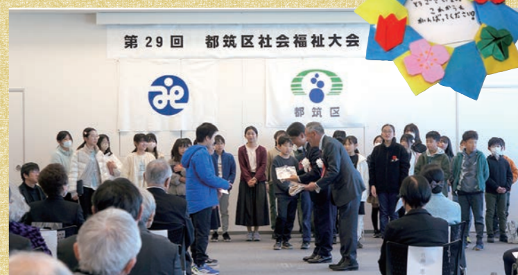
社会福祉大会当日の様子