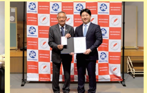
ヤマザキ製パン従業員組合 神奈川支部様