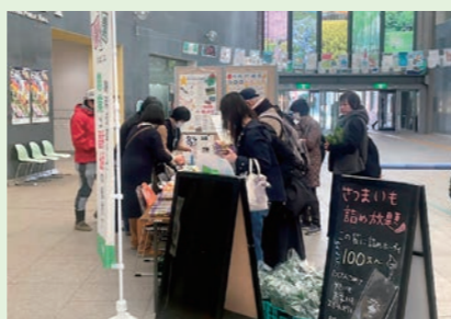
都筑野菜販売の様子