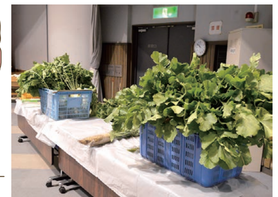
地域の方からいただいたお野菜