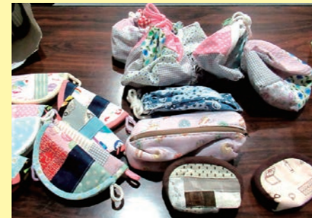
個人の方からの寄付(手作り製品)