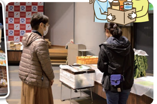
お渡し会当日の様子

都筑区在住の18歳以下のお子さんと同居している食にお困りの世帯50世帯計180名のみなさまに食料品、日用品等の配分を行いました。お渡しをした食料品・日用品は、都筑区内の住民や団体、企業から集まった寄付品をお渡ししました。寄付して下さったみなさまや周知の協力、当日の支援をして下さったみなさまありがとうございました。