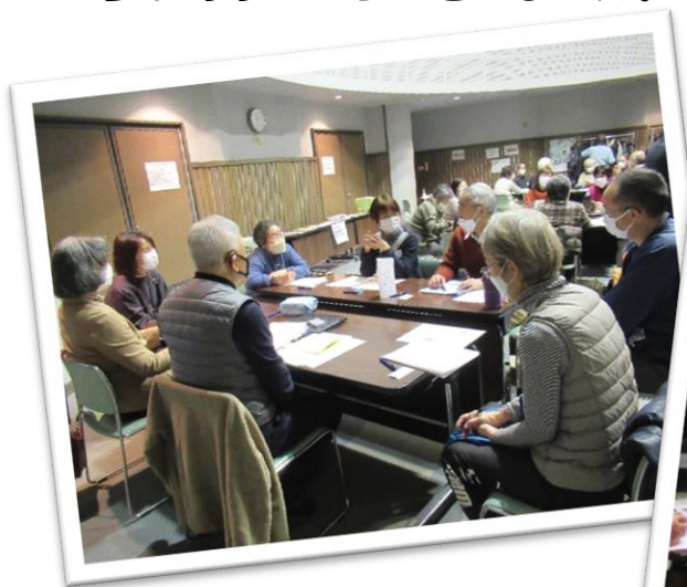
▲1月19日交流会の様子