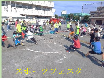
スポーツフェスタ