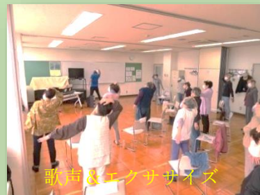
歌声&エクササイズ