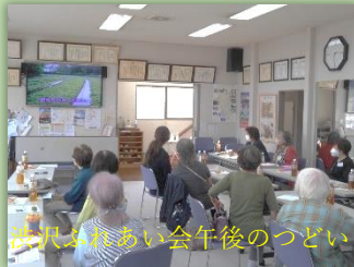
渋沢ふれあい会午後のつどい