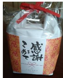
都筑が丘第2自治会