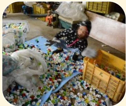
ボランティア たうん都田1