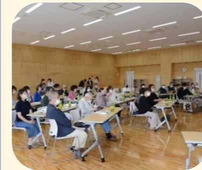
福祉訪問員研修会