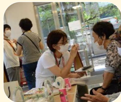
みやこちゃん サロン2