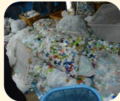
ボランティア たうん都田2