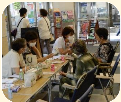
みやこちゃん サロン1