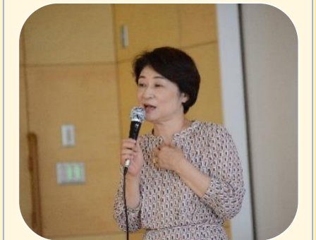
特別講演 発達障害について