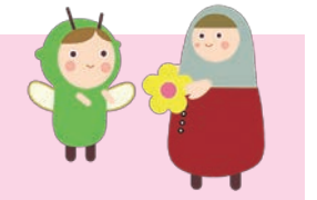
株式会社 大興リサイクル 様からの寄付

令和5年10月1日~令和6年1月15日現在(敬称略、順不同) 区内14郵便局/アーチドゥーク・オーディオ株式会社 大興リサイクル/区内6地域ケアプラザ 横浜あゆみ荘/都筑センター/都筑区役所 荏田南中学校/ポッシュマネージャーズ