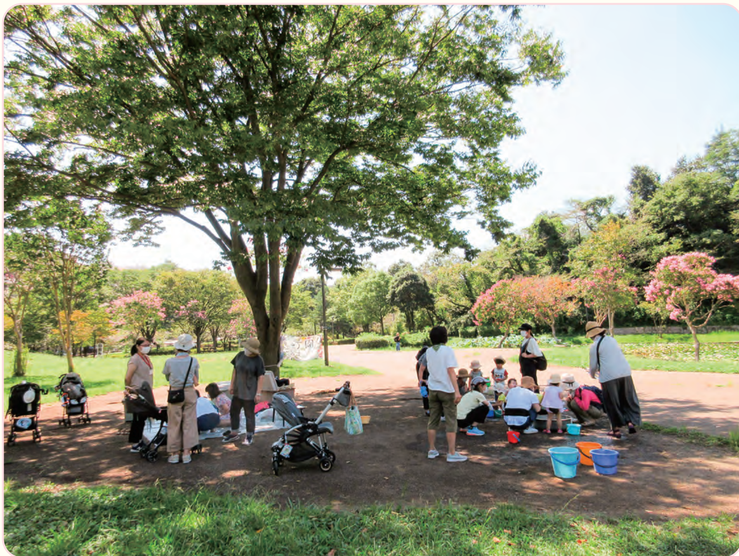
「山田富士公園であそぼう」 広い芝生の公園に、親子の歓声が響きます。